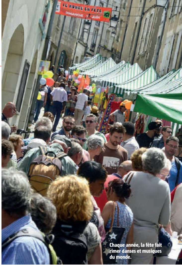
Chaque année, la fête fait rimer danses et musiques du monde.

Programme complet sur toitdumonde.centres-sociaux.fr