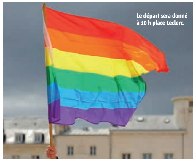
Le départ sera donné à 10 h place Leclerc.