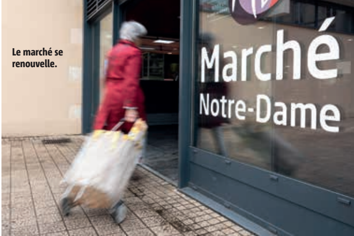
Le marché se renouvelle.