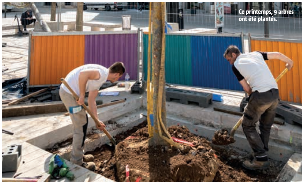
Ce printemps, 9 arbres ont été plantés.

Entrée par la cour 26 boulevard Pont-Achard.