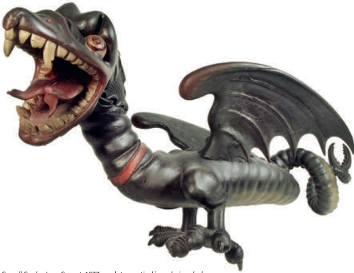
La Grand' Goule, Jean Gargot, 1677 - sculpture articulée en bois polychrome.