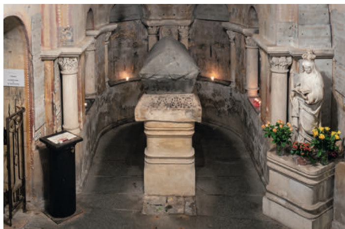
Dans la crypte, le tombeau de Radegonde.