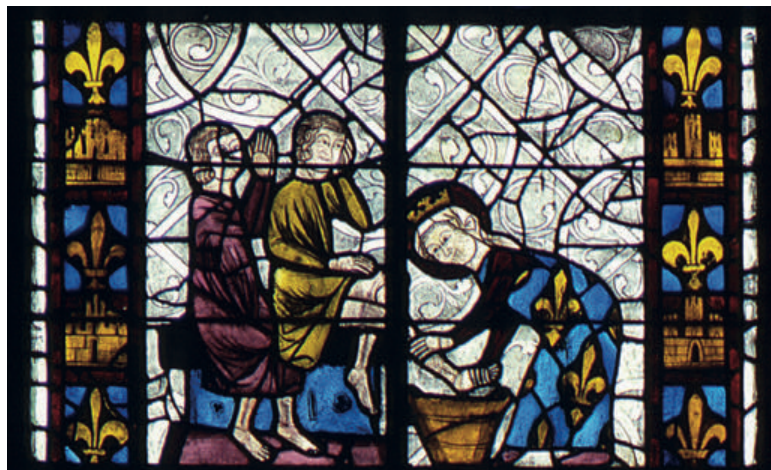
Radegonde lave les pieds des pauvres. Vitrail du XIII e siècle.