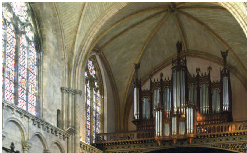
Le Grand orgue.