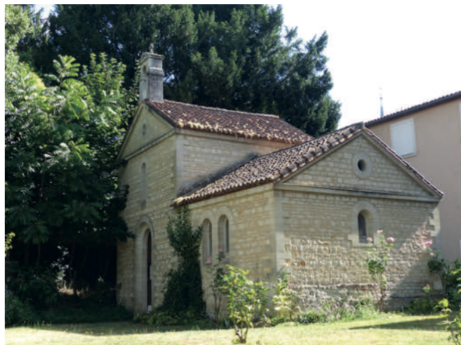
La chapelle du « Pas-de-Dieu ».