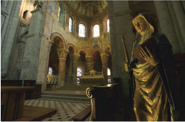
Vue sur le chœur roman.