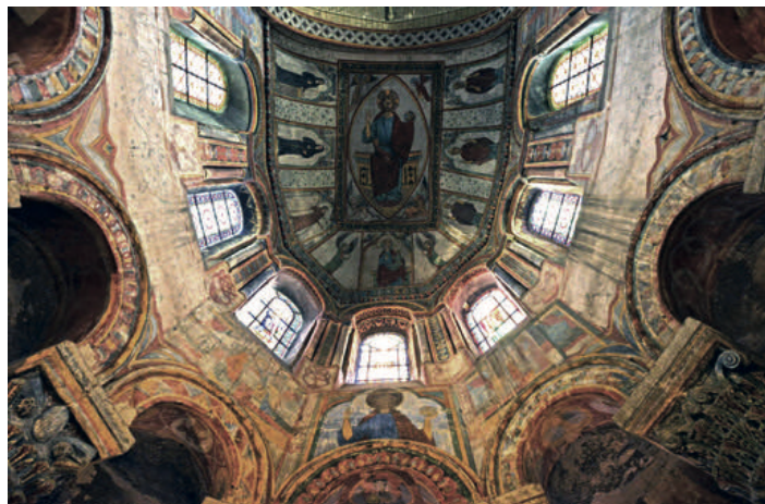
Le décor peint du chœur roman.