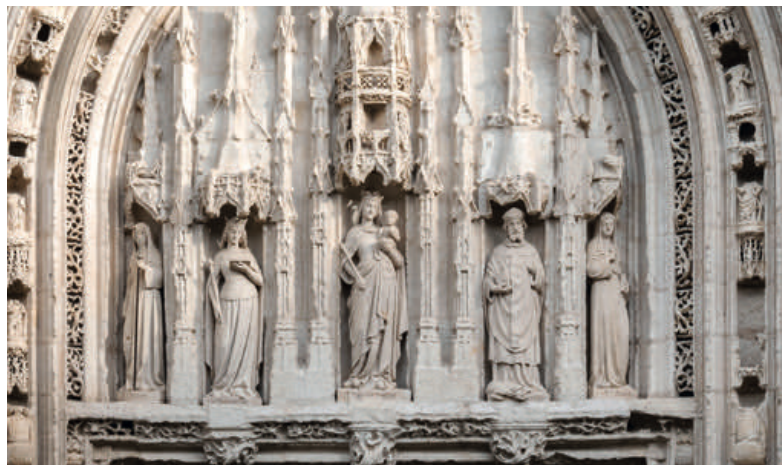
Le portail de l'église, détail.