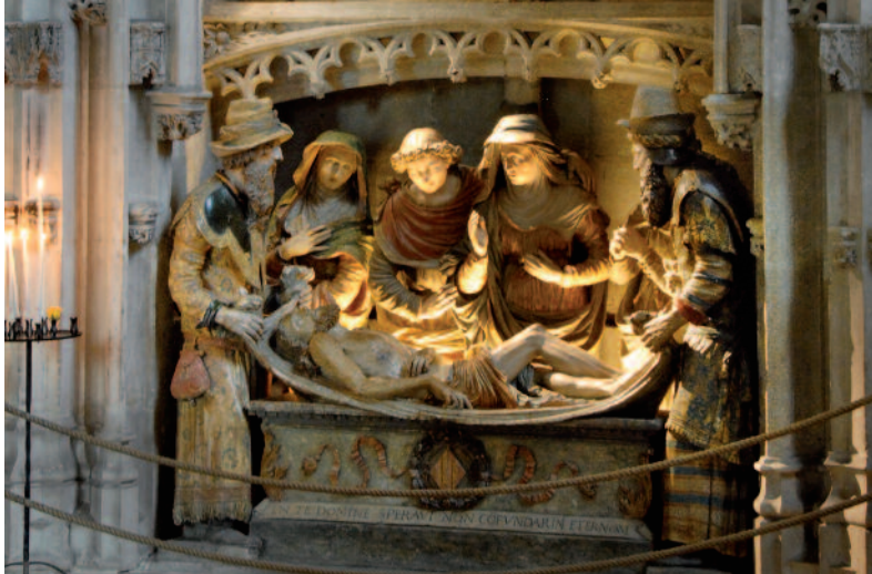
Mise au tombeau - Chapelle Sainte-Anne, dite du Fou Entombment - Sainte-Anne chapel (Chapelle du Fou)