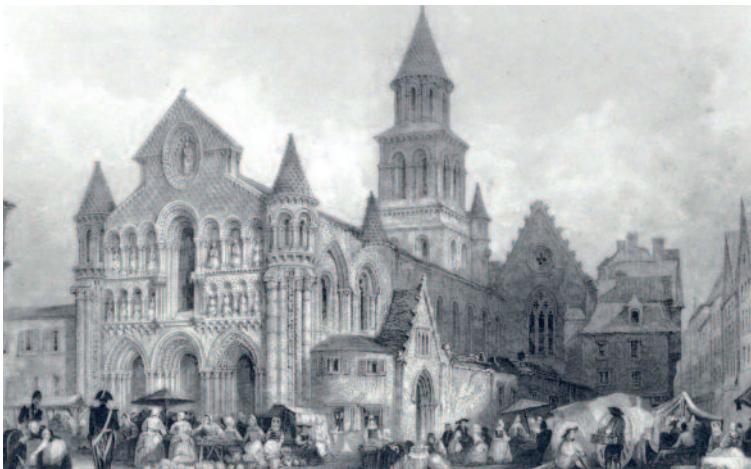
Notre-Dame-la-Grande, dessin de Thomas Allom, vers 1830

Tout au long des XV e et XVI e siècles, différentes chapelles privées appartenant aux familles de la haute bourgeoisie poitevine sont aménagées du côté nord de l'église. En 1562, le bâtiment subit les destructions des Huguenots qui pillent l'édifice, brûlent les reliques et décapitent la plupart des statues de la façade par iconoclasme*.