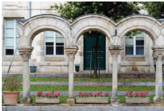
Vestige du cloître de l'église, cour de la faculté de Droit Sculptures from the cloister, courtyard of the Law school