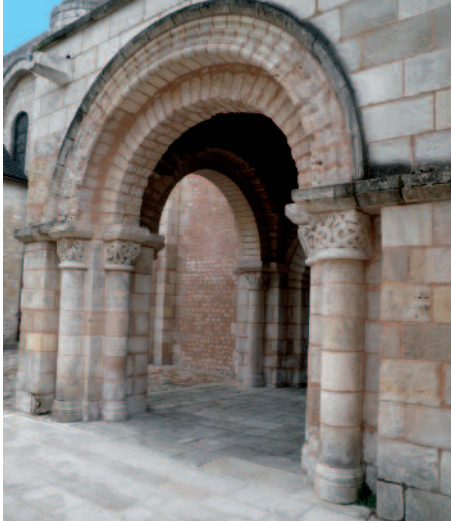
Porche roman Romanesque porch

Le clocher est couronné d'un toit en écailles. C'est une forme de couverture fréquente dans le Grand Ouest. Il se retrouve par exemple à Saintes ou à Angoulême. Le mur sud conserve son porche roman, bien que très restauré au XIX e siècle. Il était surmonté à l'époque romane d'un cavalier sculpté, haut-relief refait au XVII e siècle puis détruit après la Révolution. Un petit porche gothique a été rajouté au XV e siècle. Les bâtiments des chanoines étaient situés du côté nord de la nef. Le cloître, datant des XII e et XIII e siècles, est totalement démoli en 1859. Les sculptures de ce cloître sont visibles dans la cour de la faculté de droit (en face de l'église) et au musée Sainte-Croix. La porte murée du cloître est toujours visible dans l'église.