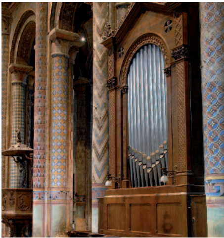
Petit orgue de chœur - XIX e siècle Small choir organ, 19th century