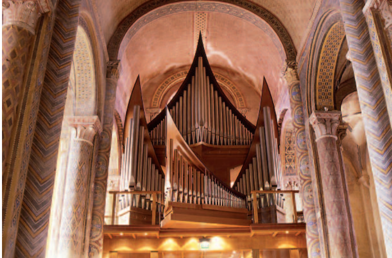
Le grand orgue - XX e siècle The Great Organ, 20th century