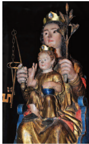
Notre-Dame-des-Clefs - XVII e siècle Our Lady of the Keys, 17th century

Dans le chœur se trouve une statue de la Vierge à l'Enfant, appelée Notre-Dame-des-Clefs . Selon une légende médiévale, la Vierge serait intervenue afin d'éviter que la ville ne soit livrée aux Anglais par un traître qui voulait leur en donner la clef. Disparu, le précieux objet fut retrouvé miraculeusement dans la main de la statue. C'était l'origine d'une grande procession ayant lieu tous les lundis de Pâques, jusqu'au XIX e siècle. La statue actuelle, basée sur un modèle de l'époque romane, est une création du XVII e siècle.