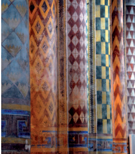
Peintures intérieures - XIX e siècle Interior murals - 19th century