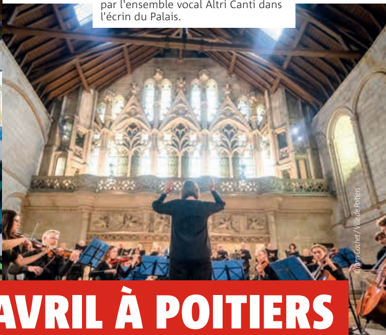
■ Magnifique Magnificat interprété par l'ensemble vocal Altri Canti dans l'écran du Palais.