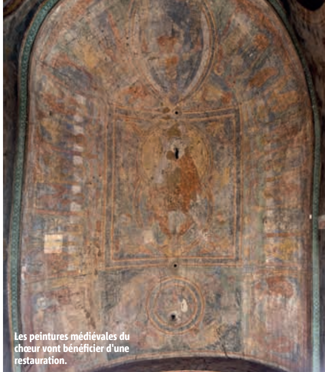
Les peintures médiévales du chœur vont bénéficier d'une restauration.

un état préoccupant. Ils sont très sales, soumis à des remontées capillaires qui les dégradent. Le décor de la voûte est clairement en péril. » Ces peintures, que l'on peut attribuer à l'atelier qui a réalisé les peintures de Saint-Savin-sur-Gartempe et de Saint-Hilaire-le-Grand, étaient protégées jusqu'au milieu du XIX e siècle par un badigeon apposé au XVII e siècle. « C'est un chef-d'œuvre d'une extrême fragilité, constate Géraldine Fray. Des essais de protocole d'intervention ont été menés, aboutissant à une solution basée sur un nettoyage au laser et une fixation de la couche picturale à la seringue ou à l'imprégnation. » Protocole à suivre, histoire d'assurer l'avenir de la belle Notre-Dame. L'opération, estimée à plusieurs millions d'euros, devra s'échelonner sur plusieurs années et faire appel à des soutiens extérieurs.