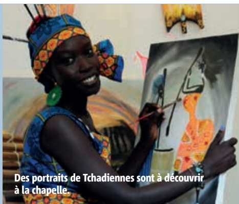
Des portraits de Tchadiennes sont à découvrir à la chapelle.

En mai, la chapelle Saint-Louis accueille trois expositions. Primo , du 6 au 15 mai, « Seconde vie », est proposée par ABOZART : installations, sculptures, photos, peintures, gravures sont réalisées à partir d'éléments récupérés et transcendés par la créativité. Vernissage jeudi 5 mai à 18h, ouvert tous les jours de 14h30 à 18h30. Secundo , du 17 mai au 29 mai, place à l'exposition du Cercle Poitevin des Arts. Les membres de l'association présentent