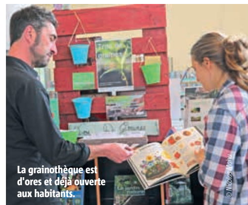
La grainothèque est d'ores et déjà ouverte aux habitants.