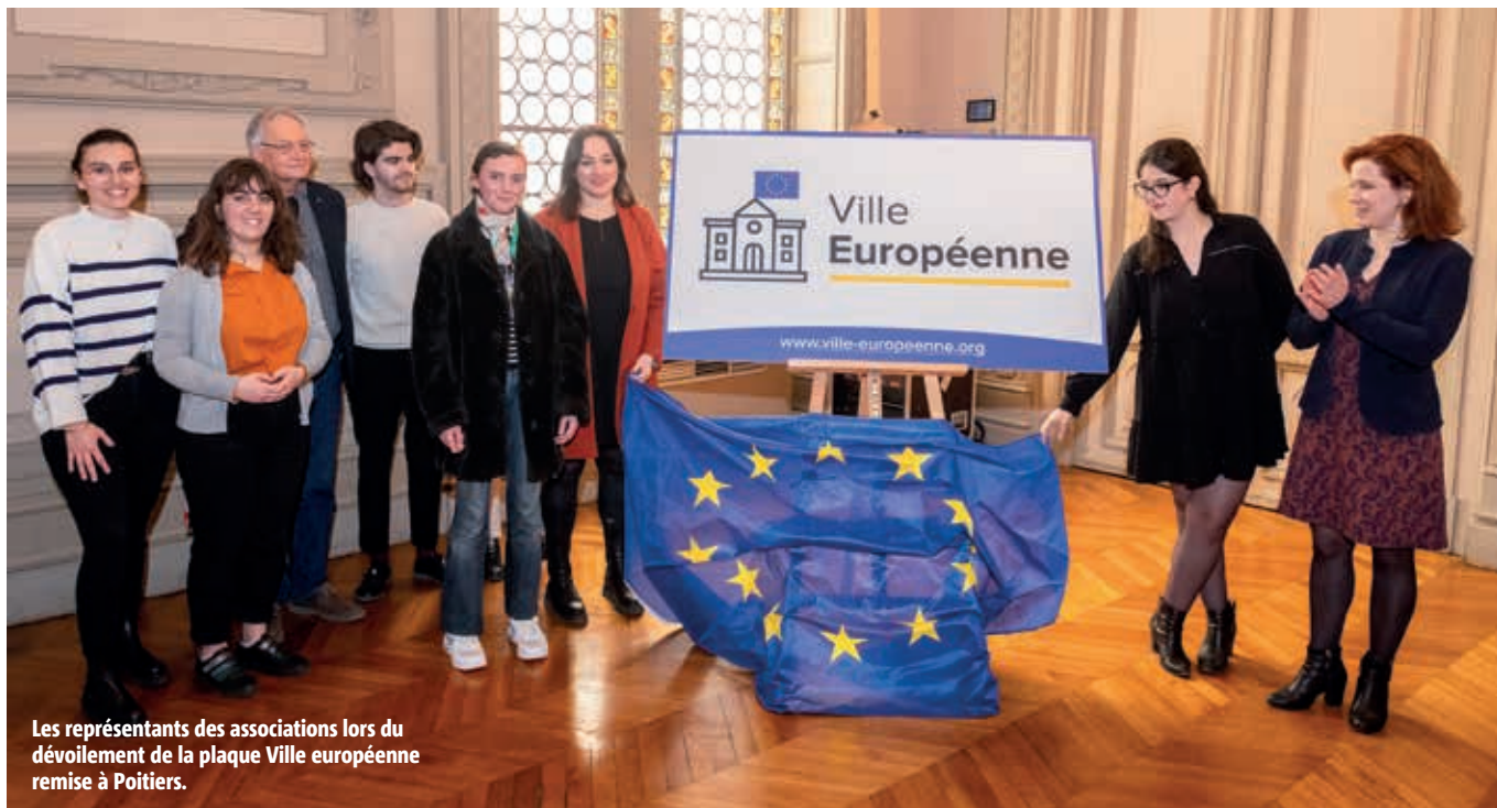
Les représentants des associations lors du dévoilement de la plaque Ville européenne remise à Poitiers.