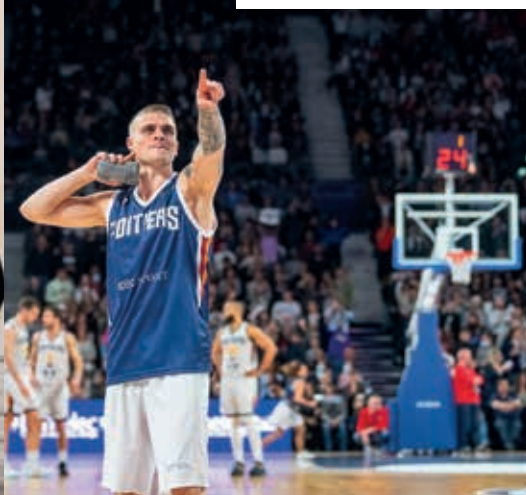
■ Pour son 1 er match à l'Arena, le PB86 a mené le match haut la main devant plus de 5 000 spectateurs.