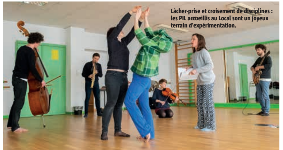
Lâcher-prise et croisement de disciplines : les PIL accueillis au Local sont un joyeux terrain d'expérimentation.