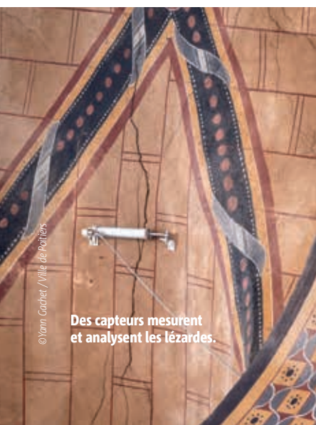
Des capteurs mesurent et analysent les lézardes.