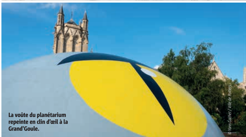
La voûte du planétarium repeinte en clin d'œil à la Grand'Goule.