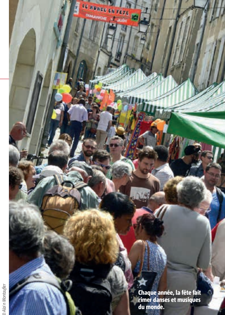
Chaque année, la fête fait rimer danses et musiques du monde.

Programme complet sur toitdumonde.centres-sociaux.fr