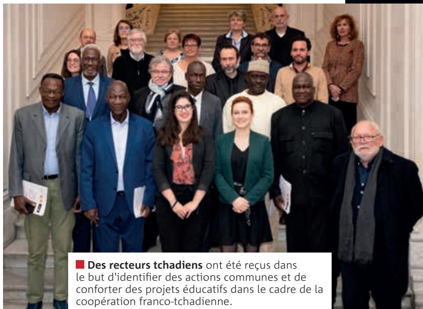
■ Des recteurs tchadiens ont été reçus dans le but d'identifier des actions communes et de conforter des projets éducatifs dans le cadre de la coopération franco-tchadienne.