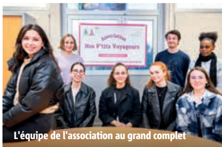
L'équipe de l'association au grand complet