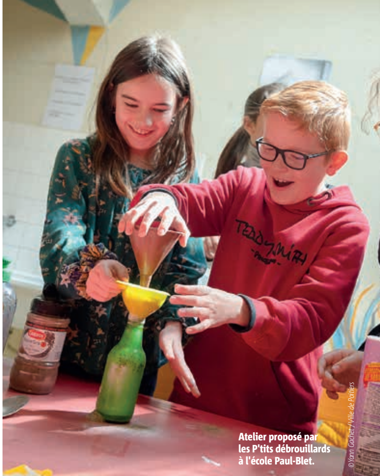
Atelier proposé par les P'tits débrouillards à l'école Paul-Blet.