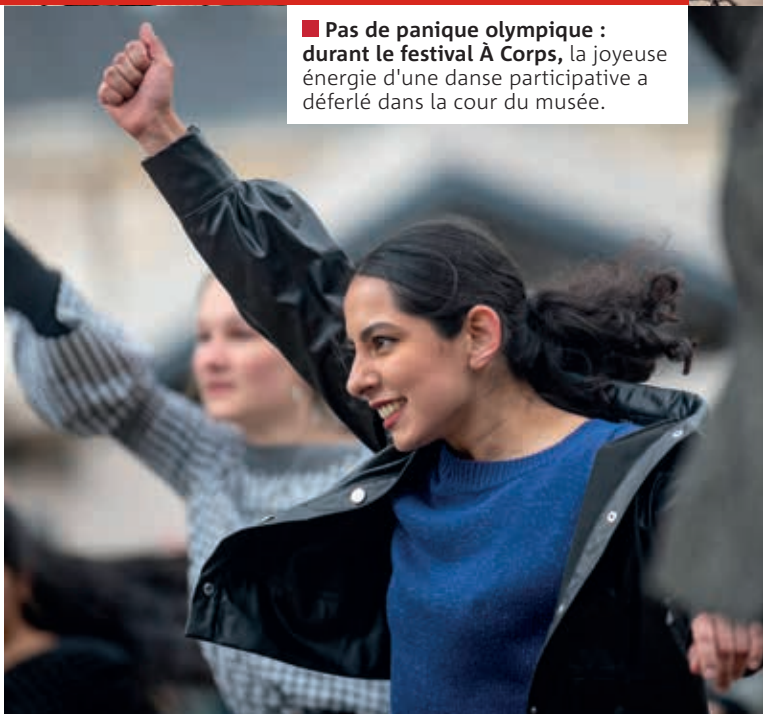
■ Pas de panique olympique : durant le festival À Corps , la joyeuse énergie d'une danse participative a déferlé dans la cour du musée.