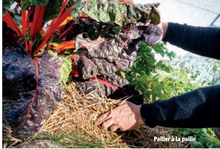
Pailler à la paille