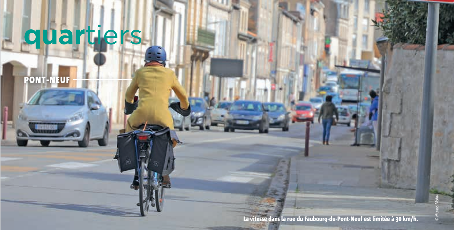
La vitesse dans la rue du Faubourg-du-Pont-Neuf est limitée à 30 km/h.