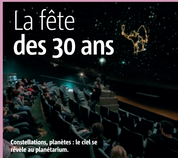
Constellations, planètes : le ciel se révèle au planétarium.