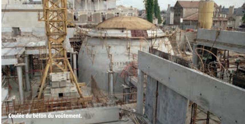
Coulée du béton du voûtement.