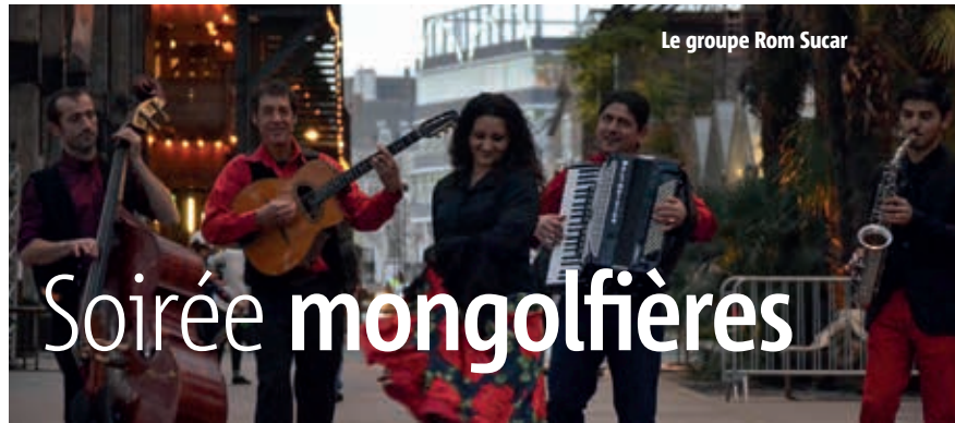
Le groupe Rom Sucar