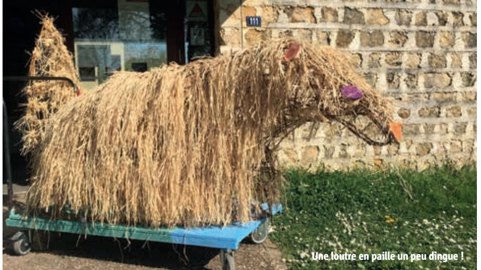
Une loutre en paille un peu dingue !