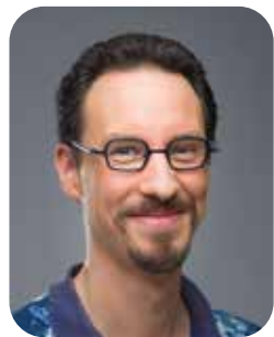
Pierre Rigollet Bientraitance animale