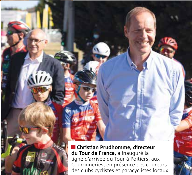
■ Christian Prudhomme , directeur du Tour de France , a inauguré la ligne d'arrivée du Tour à Poitiers, aux Couronneries, en présence des coureurs des clubs cyclistes et paracyclistes locaux.