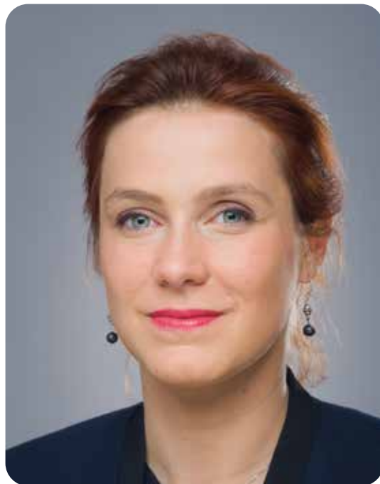
Léonore Moncond'huy Maire de Poitiers

Le Conseil municipal est composé de 53 élu·es et élus, dont 15 adjointes et adjoints à la Maire de Poitiers.