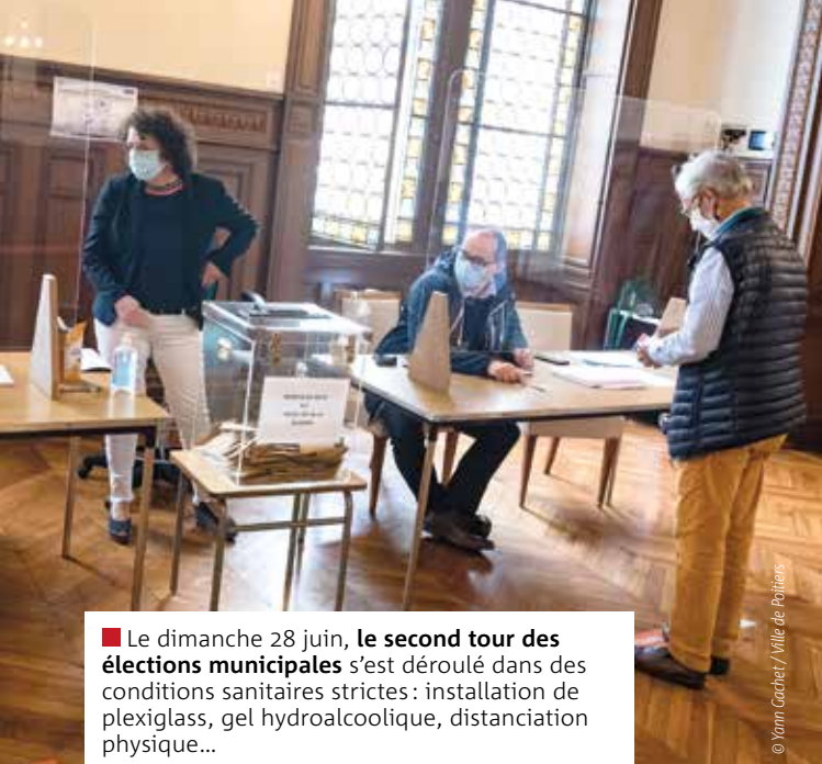
■ Le dimanche 28 juin, le second tour des élections municipales s'est déroulé dans des conditions sanitaires strictes : installation de plexiglass, gel hydroalcoolique, distanciation physique...