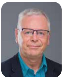
Christian Michot Engagement citoyen et vie associative