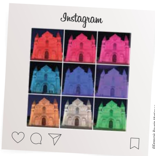
■ Kimsooja-Solarescope , à découvrir tout l'été sur la façade de l'église Notre-Dame-la-Grande.