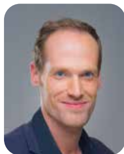
Pierre Nénez Végétalisation de la ville et éducation à la nature