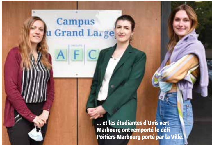
... et les étudiantes d'Unis vert Marbourg ont remporté le défi Poitiers-Marbourg porté par la Ville.