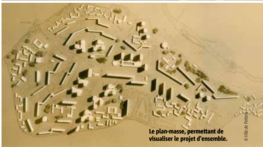
Le plan-masse, permettant de visualiser le projet d'ensemble.