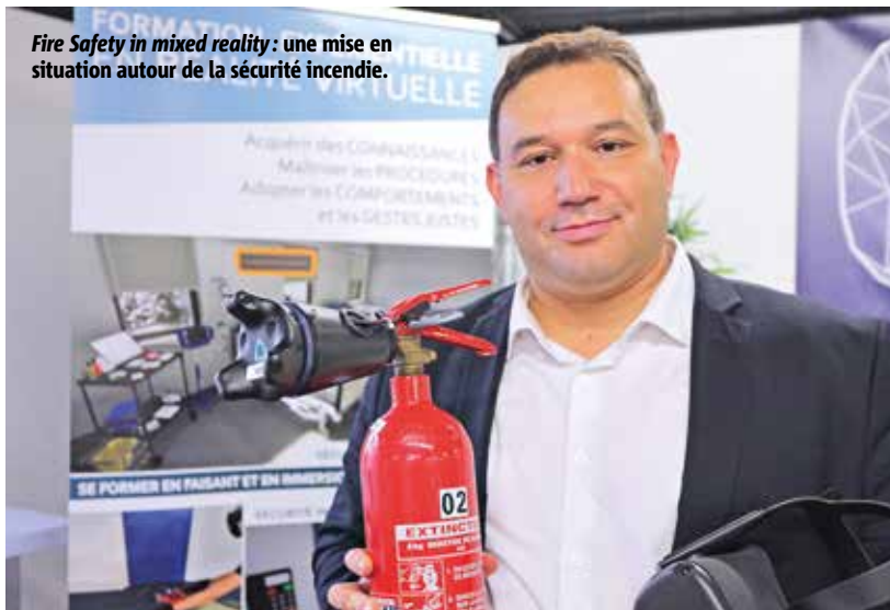
Fire Safety in mixed reality: une mise en situation autour de la sécurité incendie.

Candidatures ouvertes jusqu'au 14 juillet sur : vienn.chambre-agriculture.fr/transformercestgagner