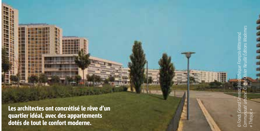
Les architectes ont concrétisé le rêve d'un quartier idéal, avec des appartements dotés de tout le confort moderne.