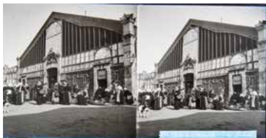
La vue stéréoscopique, ancêtre de la 3D.

Livre d'heure, œuvre d'art contemporain, manuscrit du XIX e ... La médiathèque François-Mitterrand recèle des trésors cachés. Poitiers Mag lève le voile sur leur histoire. Ce mois-ci : des vues stéréoscopiques.