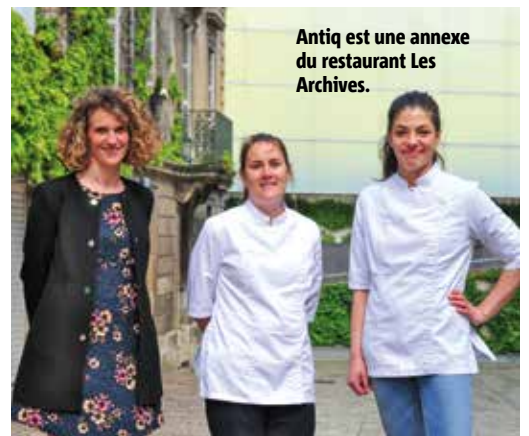
Antiq est une annexe du restaurant Les Archives.

Épicerie fine, plats à emporter, ateliers gourmets et cantine-café-salon de thé, Antiq se propose de faire redécouvrir, sous toutes ses facettes, le plaisir des petits plats savoureux, cuisinés comme autrefois... ou plutôt comme aux Archives. Le lieu, rue Edouard-Grimaux, est une annexe décontractée et plus abordable du restaurant gastronomique niché dans l'ancienne chapelle juste en face. Sa création répond au besoin d'un espace adapté pour les ateliers cuisine et pâtisserie proposés par Alexandre et Aline Beaudoux, respectivement chef et chef pâtissier aux Archives. Le développement de la vente à emporter lors des différents confinements a ajouté une carte supplémentaire à ce nouveau lieu de vie multifonction. Et c'est tout autant la modularité que le style atelier industriel qui ont tracé les lignes d'une déco à la fois authentique, vintage et moderne.