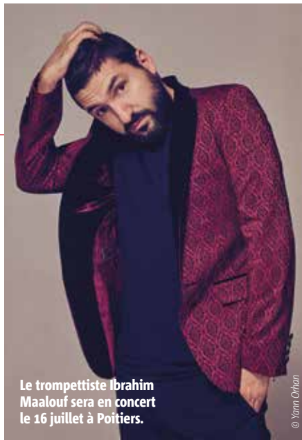
Le trompettiste Ibrahim Maalouf sera en concert le 16 juillet à Poitiers.