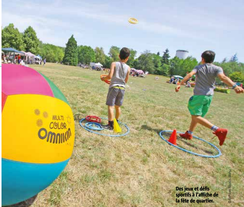
Des jeux et défis sportifs à l'affiche de la fête de quartier.