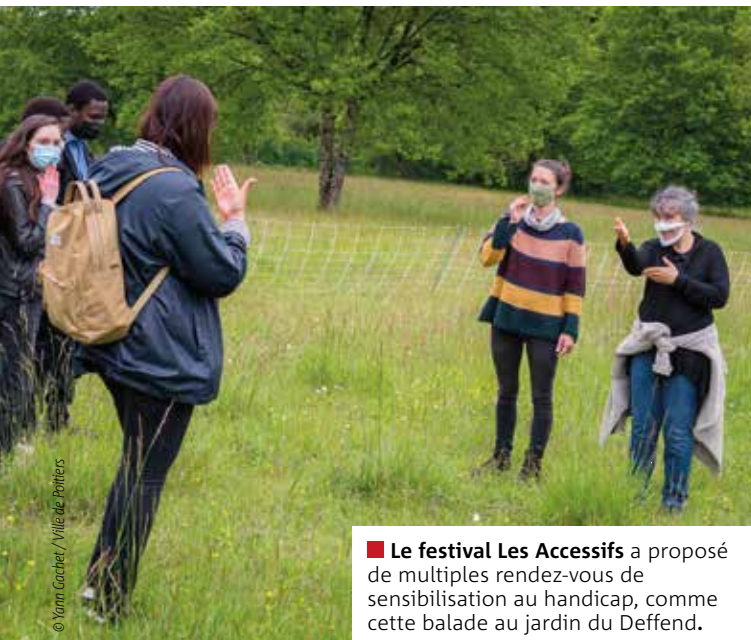
■ Le festival Les Accessifs a proposé de multiples rendez-vous de sensibilisation au handicap, comme cette balade au jardin du Deffend.