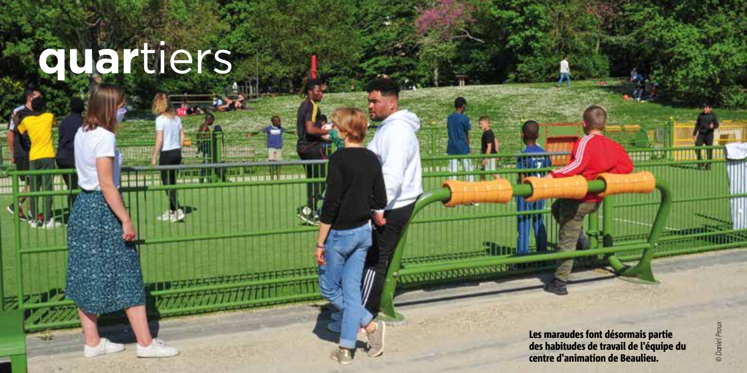
Les maraudes font désormais partie des habitudes de travail de l'équipe du centre d'animation de Beaulieu.