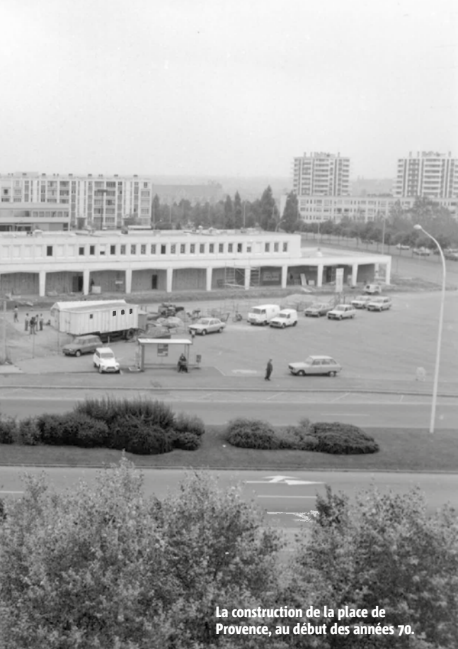
La construction de la place de Provence, au début des années 70.