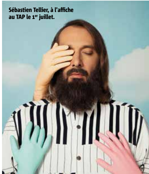
Sébastien Tellier, à l'affiche au TAP le 1 er juillet.

LES DATES À NOTER ♦ 25 ET 26 JUIN : 90 ans de la Maison du Peuple organisés par le collectif regroupant l'Institut d'Histoire Sociale, des syndicats (CGT, CFTC, UNSA) et des universitaires. | Rdv le 25 juin pour une conférence sur la place du syndicat dans la cité. | Les 25 et 26 juin : portes ouvertes de la Maison du Peuple avec exposition. Plus d'infos sur cgt-ud86.org