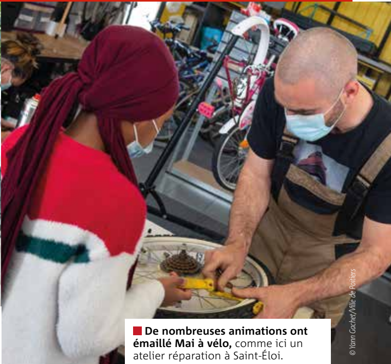
■ De nombreuses animations ont émaillé Mai à vélo, comme ici un atelier réparation à Saint-Éloi.