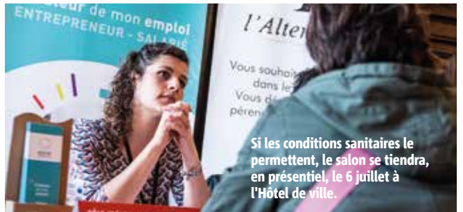
Si les conditions sanitaires le permettent, le salon se tiendra, en présentiel, le 6 juillet à l'Hôtel de ville.