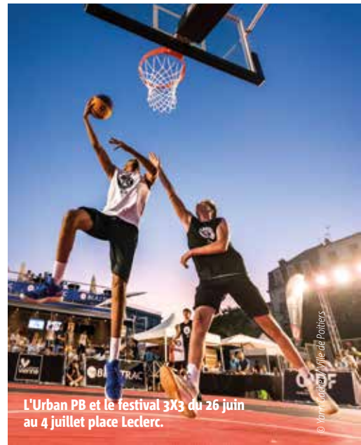
L'Urban PB et le festival 3x3 du 26 juin au 4 juillet place Leclerc.

Musique, spectacles, culture, loisirs... De nombreuses animations habillent la saison estivale. Tour d'horizon - non exhaustif - des manifestations du début d'été.