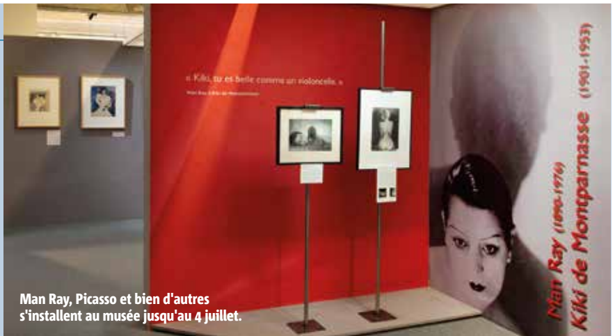
Man Ray, Picasso et bien d'autres s'installent au musée jusqu'au 4 juillet.

Ça y est, il est déconfiné ! Et pour fêter ça, l'accès au musée Sainte-Croix est exceptionnellement gratuit jusqu'au 20 septembre. Enfin ouverte au public, la tant attendue exposition « L'Amour fou ? Intimité et création (1910-1940) » est prolongée jusqu'au 4 juillet. Attention, les modalités de visite et de circulation sont adaptées pour assurer la protection optimale de