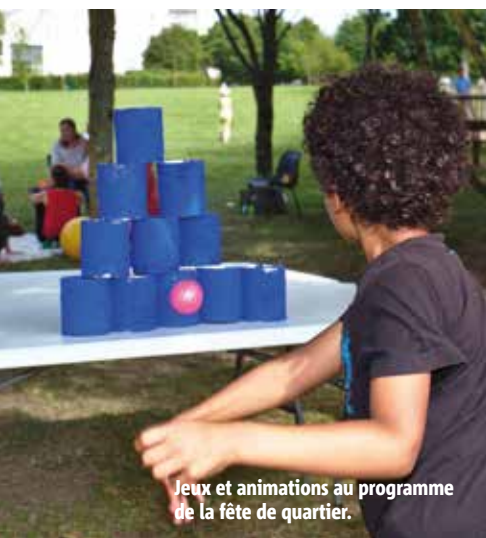
Jeux et animations au programme de la fête de quartier.