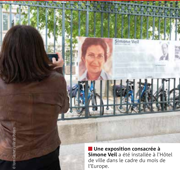
■ Une exposition consacrée à Simone Veil a été installée à l'Hôtel de ville dans le cadre du mois de l'Europe.