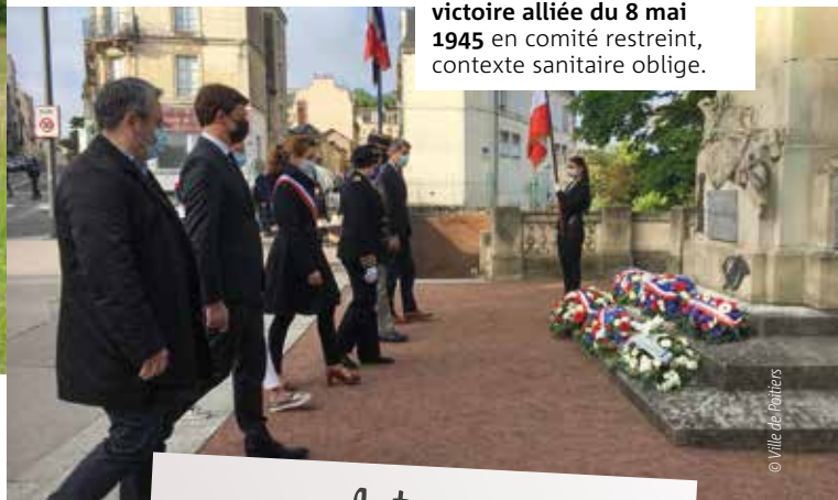
■ Une cérémonie de commémoration de la victoire alliée du 8 mai 1945 en comité restreint, contexte sanitaire oblige.