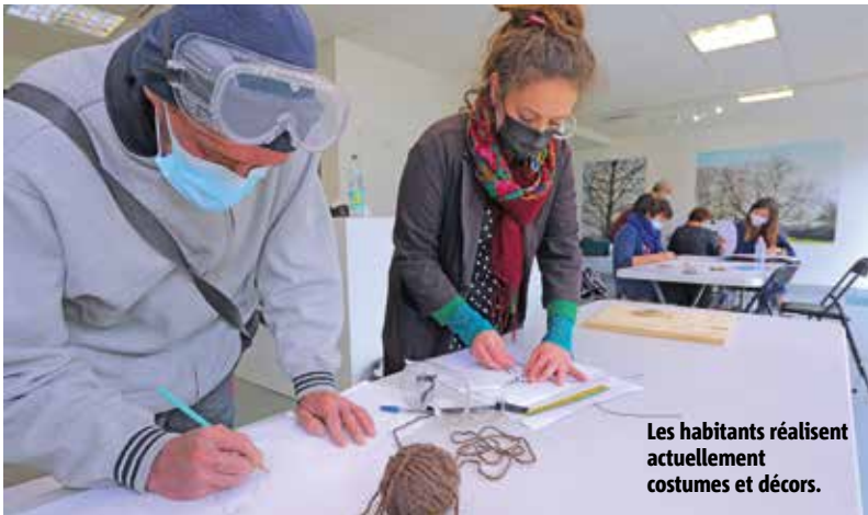
Les habitants réalisent actuellement costumes et décors.