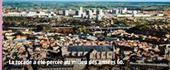
La rocade a été percée au milieu des années 60.