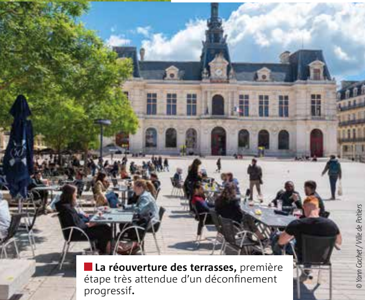
■ La réouverture des terrasses, première étape très attendue d'un déconfinement progressif.