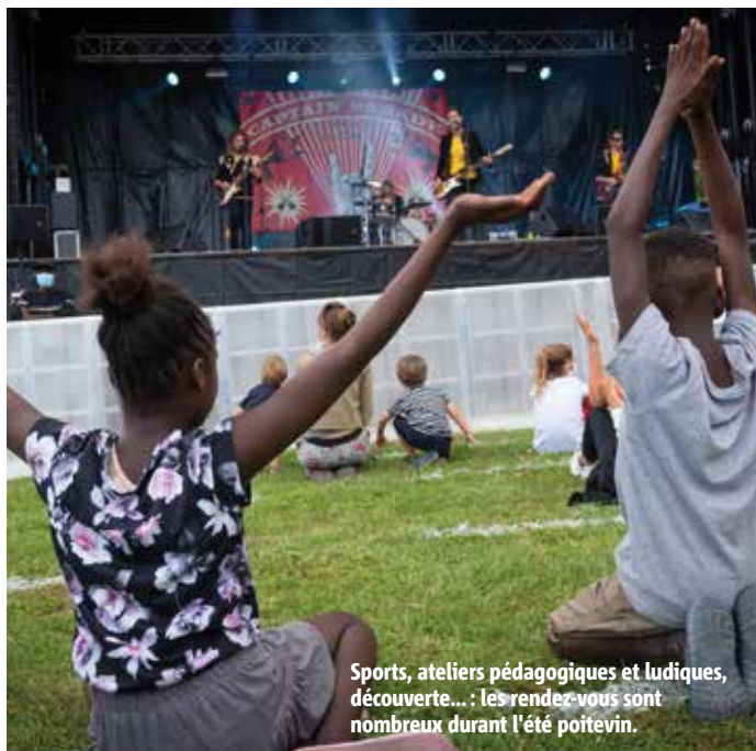
Sports, ateliers pédagogiques et ludiques, découverte... : les rendez-vous sont nombreux durant l'été poitevin.

Pour les semaines passées à Poitiers cet été, les activités ne manquent pas. Quelques exemples faits pour plaire aux enfants et aux familles.