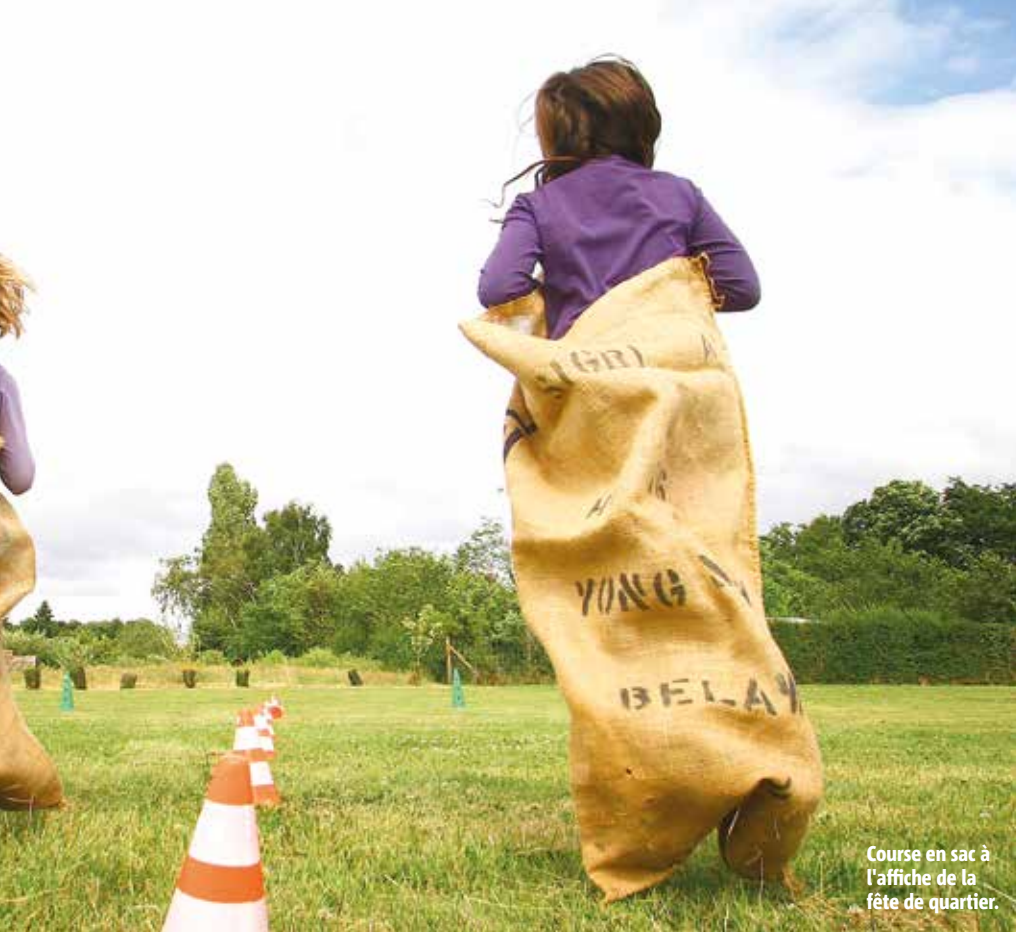
Course en sac à l'affiche de la fête de quartier.